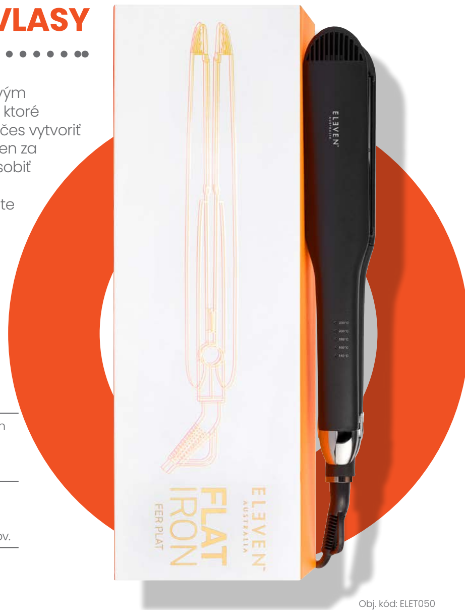
Obj. kód: ELET050