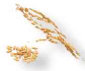
HYDROLYZOVANÝ RYŽOVÝ PROTEÍN Zvyšuje objem vlasov a zároveň zlepšuje flexibilitu a silu.