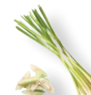
EXTRAKT Z CITRÓNovej TRÁVY Pomáha posilňovať vlasové folikuly.